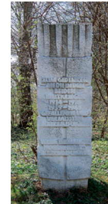
Ehrenmal der Ackerbauschüler (A)