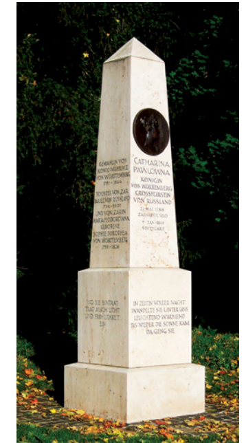
Königin Catharina-Denkmal (C)