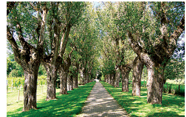
Historische Schwarzpappelallee "Jägerallee" (S)