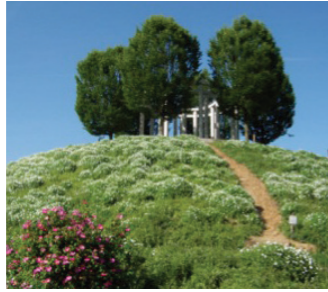
Monopteros im Landschaftsgarten

Der Exotische Garten ist der älteste Gartenteil und hat seinen Ursprung in der Anlage des Englischen Gartens von 1776 bis 1793, dem »Dörfle«. Unter König Wilhelm I. von Württemberg wurde der Garten als Exotische Landesbaumschule und Obstbaumschule genutzt. Nach 1919 begann unter der Leitung der Gartenbauschule die Umgestaltung zurück in seine ursprüngliche Form der Englischen Anlage und Arboretums.