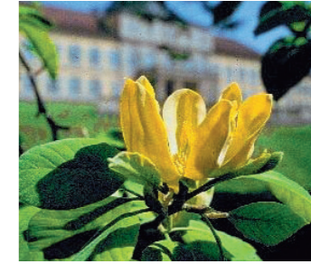
Magnolie vor dem Schloss