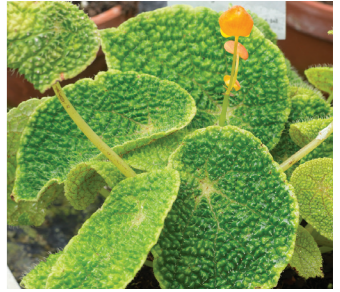
Begonie im Sammlungsgewächshaus

Der heutige Schlosspark ist aus dem alten Botanischen Garten hervorgegangen, der ab 1829 angelegt wurde. Im halbkreisförmigen Bogen werden auf einer Fläche von etwa 4,3 ha südlich des Schlosses 360 Gehölzarten gezeigt. Geht man durch den Schlosspark und entlang der Pappelallee, am Versuchsweinberg und der Schafweide vorbei Richtung Süden, erreicht man die Vegetationsgeschichtliche Abteilung des Botanischen Gartens.