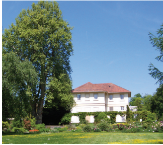
Spielhaus mit Platane